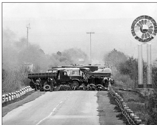
Figura 3. Materialele ilustrative dedicate Războiului din 1992 în manualul Istoria românilor și universală , ediția 2013.

consecințe umane, economice, deținuți politici 18 ș.a. În viziunea mea, trebuie propusă o cale de soluționare a conflictului, pe baza căreia elevii să poată expune păreri, idei, reflecții și eventuale soluții, însă autorii, fără a oferi date concrete despre conflict, vin către elevii de clasa a IX-a cu întrebări privind soluționarea acestuia, sarcini pe care în aceste condiții le consider utopice.