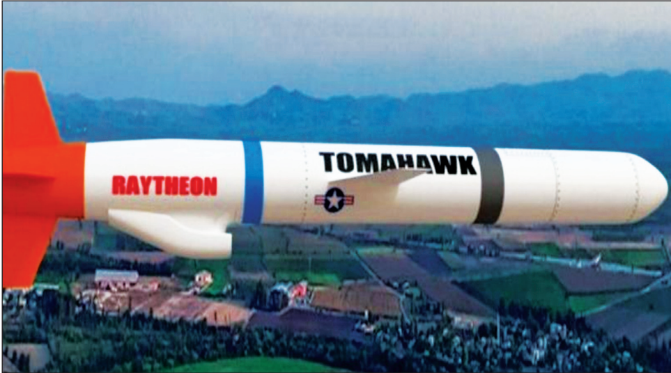
https://stiri.md/article-social-stop-fals/politica-SUA-pregatesc-o-lovitura-militara-in-Transnistria. The US is preparing a military coup in Transnistria. https://stiri.md/article-social-stop-fals/politica

răspunde prompt la știrile false, de a traduce în limba rusă și a comunica problemele, de avea contacte directe cu oamenii, de a spune lucrurilor pe nume și de a corecta informațiile false.