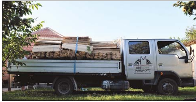
Fig. 1. Autospeciala „Ambulanței pentru monumente” aducând dranița la biserica medievală din Strei (jud. Hunedoara), 2018

nentă a patrimoniului cultural național. Deși cauzele au fost de mult timp identificate, strategiile urmate de măsuri ferme și adecvate în sensul remedierii întâmpină mereu dificultăți. Programele gestionate de Ministerul Culturii (de exemplu Programul național de restaurare a monumentelor) 1 se des-