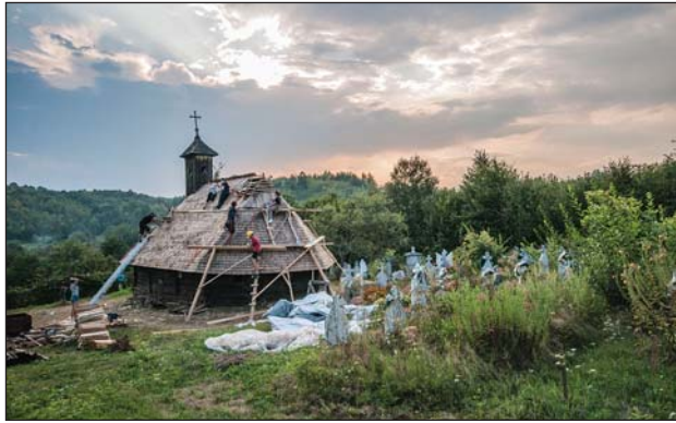
Fig. 5. Studenți lucrând alături de săteni la schimbarea acoperișului de la biserica de lemn din Jupânești (jud. Timiș), 2018

din Șaeș (jud. Mureș), sec. XIX; Poarta Brâncovească din Sâmbăta de Jos (jud. Brașov), sec. XVIII-XIX; turn din Apața („La Cetate”) (jud. Brașov), sec. XIV; turnul incintei fortificate a bisericii evanghelice din Copșa Mare (jud. Sibiu), sec. XIV-XVI-II; Halta C.F.R., Apold, jud. Mureș sec. XIX; biserică evanghelică fortificată din Alțâna (jud. Sibiu),