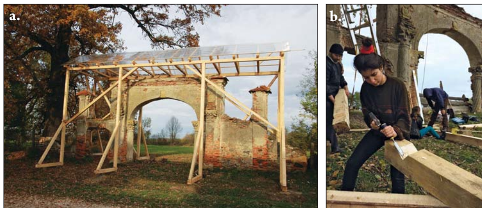
Fig. 3/a-b. Realizarea unei protecții din lemn la Poarta Brâncovenească din Sâmbăta de Jos (jud. Brașov), 2016