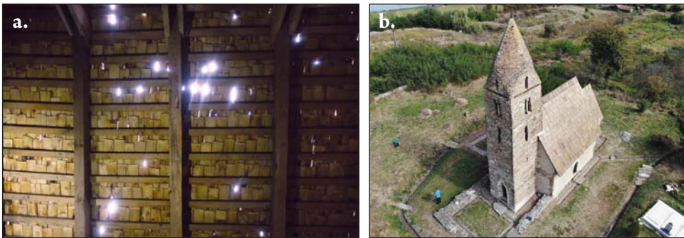
Fig. 7/a-b. Biserica medievală din Strei înainte și după refacerea învelitorii (2017, 2018)

Fig. 7/a-b. The roof of the medieval church of Strei before and after the ‘Ambulance for Monuments’ intervention