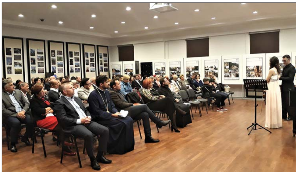
Fig. 8. Evenimente (expoziție și concert) pentru strângere de fonduri în Zalău, în scopul salvării bisericii din lemn de la Brusturi (jud. Sălaj), 2018

Fig. 8. Fundraising events (exhibition and concert) in Zalău dedicated to saving the wooden church in Brusturi (Sălaj County), 2018.