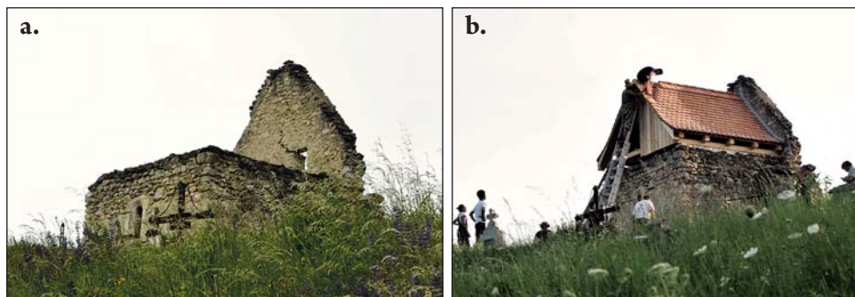
Fig. 6/a-b. Biserica medievală din Gârbova de Sus (jud. Alba) înainte și după montarea acoperișului pe altar (2017)

Fig. 6/a-b. The medieval church in Gârbova de Sus before and after the roof installation. (Alba County), 2017