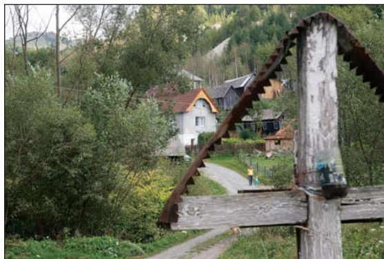
Fig. 10. Viitorul incert al Roșiei Montane