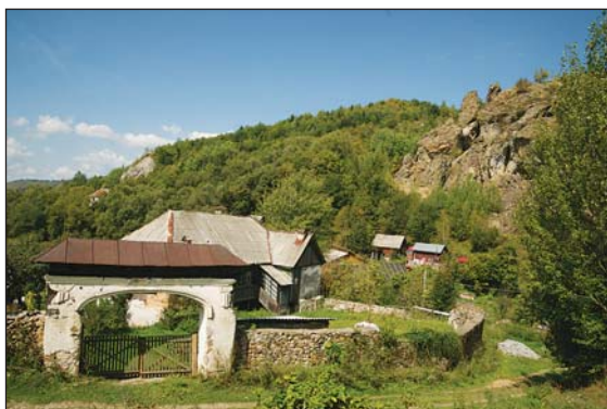
Fig. 9. Gospodărie cu poartă monumentală, părăsită Fig. 9. Abandoned household with monumental gate

în aplicare în mod consecvent, existența patrimoniului cultural devine o povară pentru comunitățile locale și pentru locuitorii acestora. În cazul României, cadrul normativ existent, chiar dacă este relativ coerent, se transformă într-o piedică în calea dezvoltării prin cultură. La Roșia Montană, pentru ca dezvoltarea prin cultură să funcționeze, sunt ne-