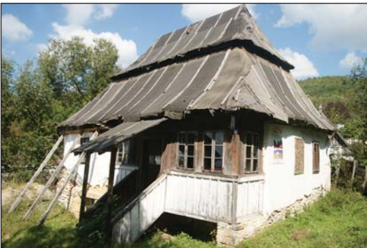
Fig. 5. Casă proprietate a RMGC Fig. 5. House, property of RMGC

În cazul Roșiei Montane, statul român, prin Ministerul Culturii, a solicitat înscrierea arealului Roșia Montană în Lista patrimoniului mondial UNESCO și a întocmit întreaga documentație necesară susținerii solicitării. Totuși, în mod oarecum neobișnuit, în timpul ședinței Comitetului prevăzut de Convenție, tot statul român, prin același Minister al Culturii, a solicitat o amânare a deciziei, motivând existența unui litigiu internațional privind drepturile de exploatare a minereurilor aurifere din arealul Roșia Montană. Această situație exprimă cel