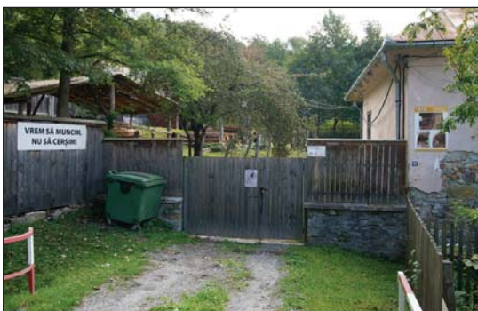
Fig. 3. Casă reabilitată de RMGC și un afiș din perioada campaniei pro-exploatare minieră