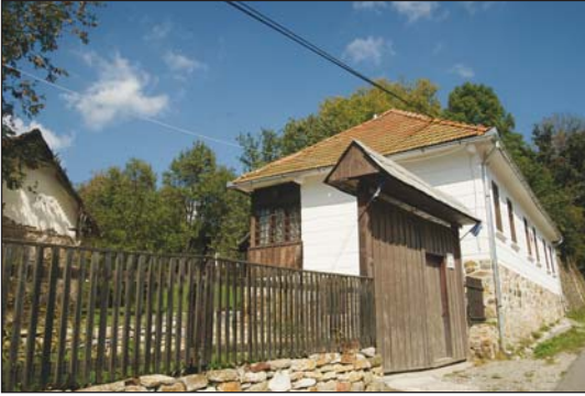
Fig. 4. Casă reabilitată parțial de RMGC Fig. 4. House partially repaired by RMGC

inacțiune, oricare ar fi aceasta. Recunoașterea internațională conferită prin înscrierea în listele UNESCO poate fi un argument în plus pentru dezvoltarea sau aplicarea unor politici naționale în domeniul turistic sau al protejării patrimoniului cultural. Totuși, recunoașterea internațională este un corolar al recunoașterii naționale, al interesului acordat de un stat patrimoniului cultural aflat pe teritoriul său. „Înscrierea unui bun pe lista patrimoniului mondial nu poate să se facă decât cu consimțământul statului interesat” (art. 11 pct. 4 din Convenție). Aceasta înseamnă că, pentru înscriere într-o listă, nu este suficient ca un bun cultural să întrunească acele condiții impuse de Convenție, ci ca statul pe al cărui teritoriu se află bunul să solicite înscrierea într-o listă și, mai mult, să-și păstreze determinarea în ceea ce privește înscrierea pe listă până în momentul în care este asumată decizia Comitetului prevăzut de Convenție.