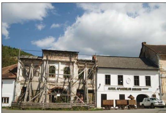
Fig. 6. Centrul Roșiei Montane

statului ar trebui să fie explicit și manifest, inclusiv în ceea ce privește starea de conservare a respectivului patrimoniu. Orașul Vechi Dubrovnik din Croația, Mina de Sare Wieliczka din Polonia sunt exemple despre felul în care statele demonstrează interesul în păstrarea patrimoniului lor cultural. Studiile și cercetările care evidențiază relevanța și importanța pentru