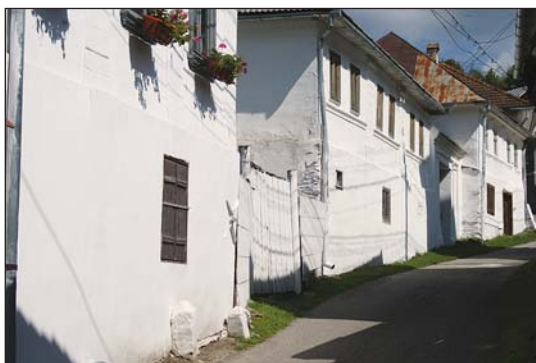
Fig. 8. Fronton la stradă în centrul Roșiei Montane Fig. 8. Street facades in center of Roșia Montană

Istoria UNESCO a moștenirii culturale de valoare universală cunoaște numeroase exemple de succes 7 în ce privește punerea în valoare (economică) a bunurilor culturale. În toate aceste cazuri, se poate constata că statele pe ale căror teritorii se află acele bunuri sunt cele care