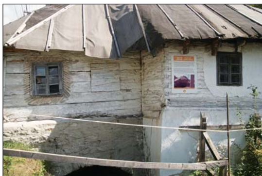
Fig. 1. Casa de peste Foieș, proprietate RMGC Fig. 1. The House over Foieș, property of RMGC

bol, a fost suscitată de o valoare culturală complexă care nu este înscrisă în vreuna dintre listele UNESCO: Roșia Montană.