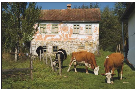
Fig. 2. Casă de miner și omniprezentele vaci din Roșia Montană

Practic, pentru un anumit stat, prezența unor bunuri culturale de pe teritoriul său în una dintre listele UNESCO este, în primul rând, o chestiune de prestigiu și, abia în plan secundar, un subiect cu relevanță financiară, economică sau de altă natură. Egida UNESCO este o oportunitate, și nu o garanție relaționată cu o acțiune sau