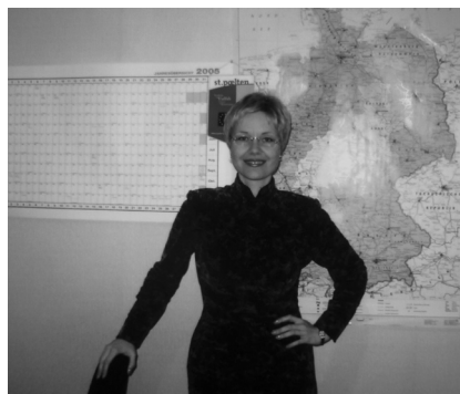
Foto 6. Fundația Friedrich Ebert, mai 2005