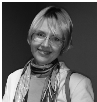
Foto 1. Musée des Beaux-Arts de Montreal, iunie 2015

recenzie semnificativă la una din monografiile privind problematica dată 2 , a publicat o monografie 3 , devenită raritate bibliografică.