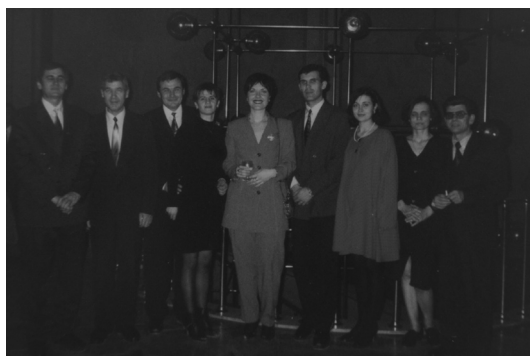
Foto 5. Revelionul de la ULIM, decembrie 1999