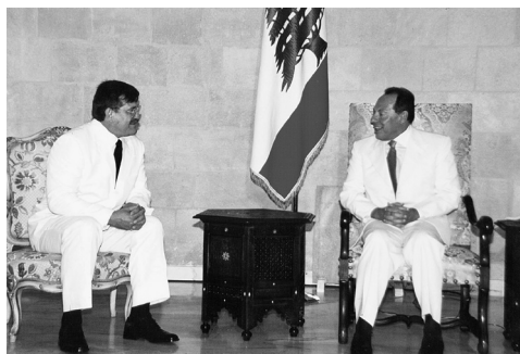
Întrevederea cu E.S. dl Emil Lahud, Președinte al Republicii Libaneze